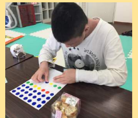
シール貼り練習。集中力がすごい！

ワーキングセンターのパン販売協力を目標にして、「南山城みちの駅へのラスクの納品」から取り組む計画を立てています。身だしなみ・挨拶などの基本的なことから、「バーコードの貼り付け」「在庫の確認」など、クリアしなければならないことは盛りだくさんです！午前は「自分の生活の振り返り」を行った後、納品先の見学へ。午後からは、納品する商品（茶処ラスク）の試食会を行って意見を出し合い、バーコード貼りの練習を行いました。