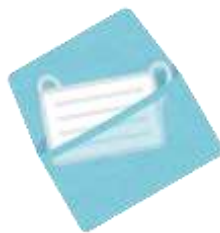
マスクの 発送作業の様子

コロナ禍で人のためになる作業に関わることができて良かったです。以前していた仕事でパンフレットを封入して送るようなことをしていたので、その時の経験を活かしました。予防さえしっかりしていれば今後も仕事は出来ると思うので、また別の仕事の機会があればやりたいと思います。