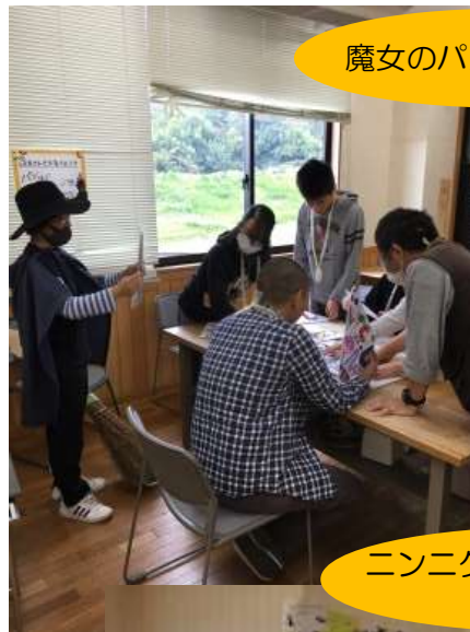
魔女のパズルに挑戦中

魔女のパズルをクリアして捕まっている職員を救出。パズルをクリアすると、カギの在りかが書かれたヒントがでてきて、みんなでカギを探して大盛り上がり！