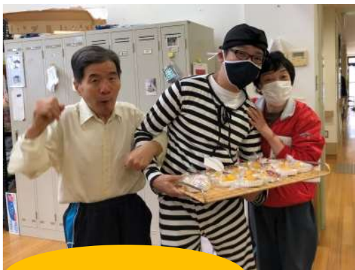
スペシャルデザート