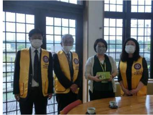
↑ 山城ライオンズクラブ様